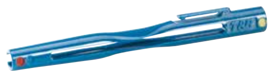
Outil unique pour asseoir n'importe quelle taille de cosse débranchable ABB